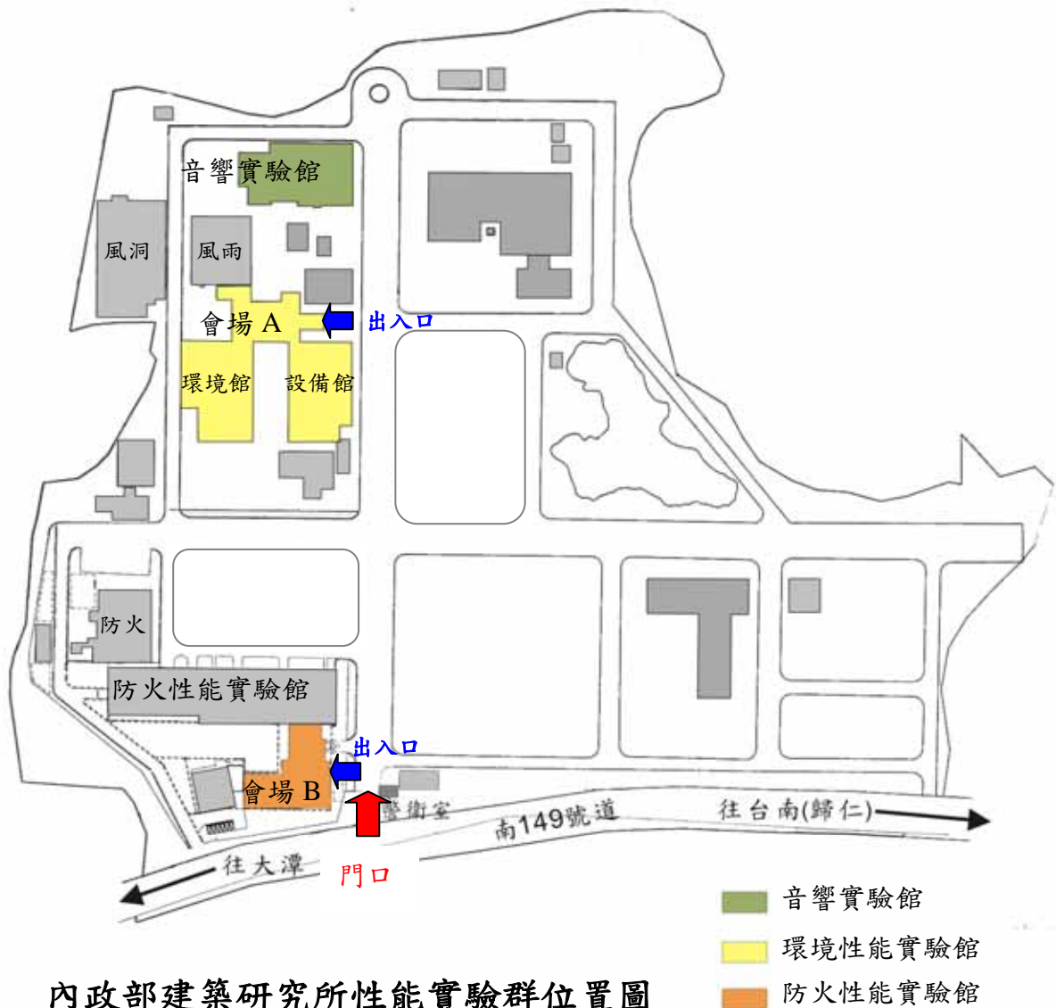
內政部建築研究所性能實驗群位置圖